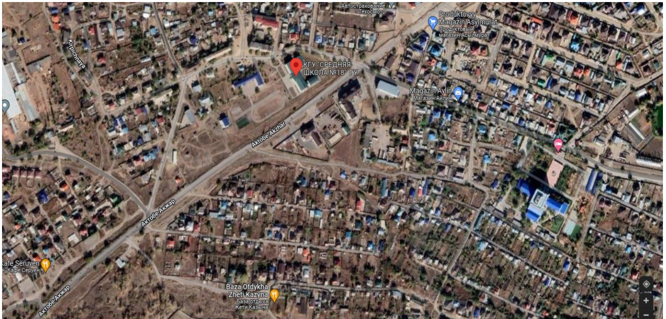
Карта места расположения точки отбора п. Кирпичный, район СШ №18