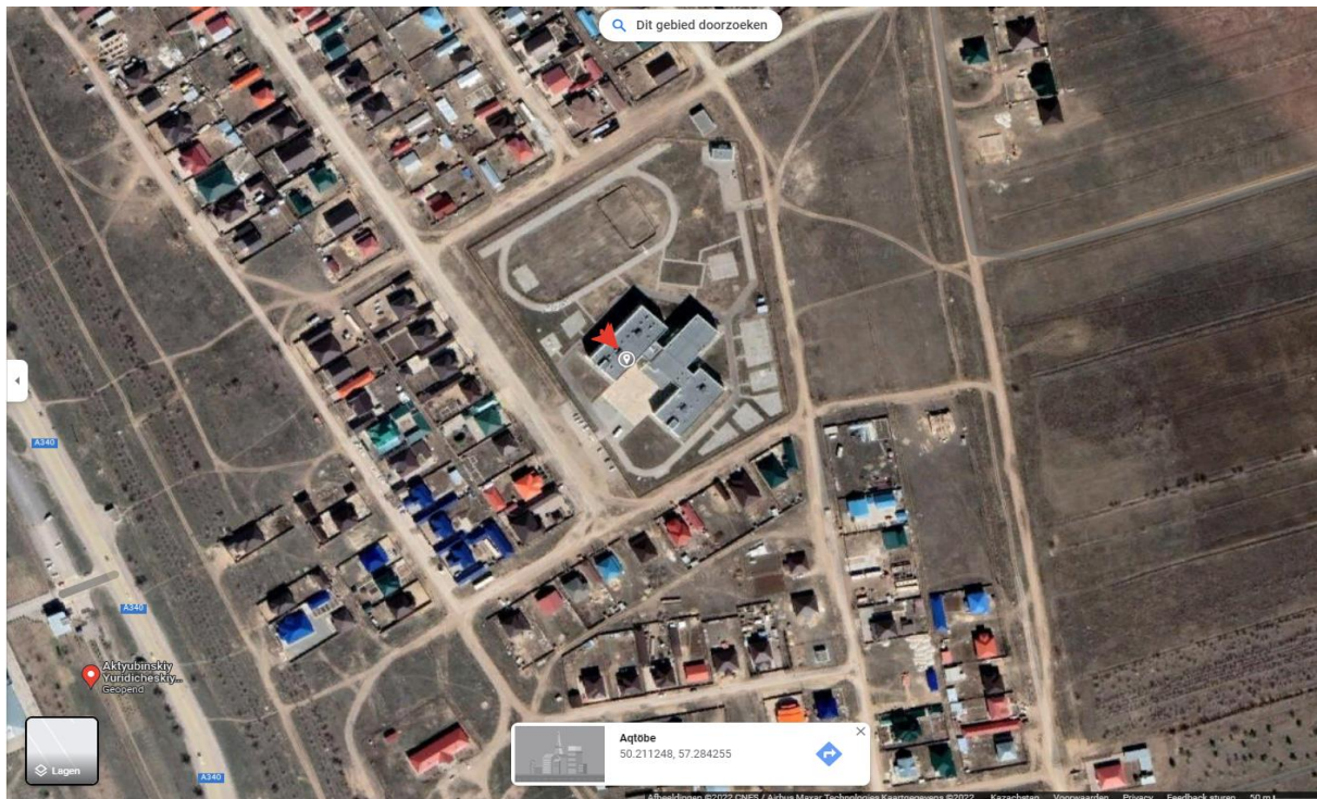
Карта места расположения точки отбора п. Ясный, район школы-гимназии №41