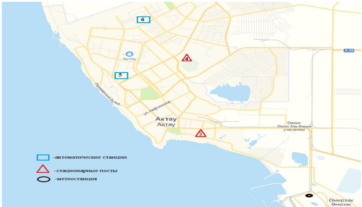
1 сурет – Ақтау қаласының атмосфералық ауа ластануын бақылау стационарлық желісінің орналасу сызбасы