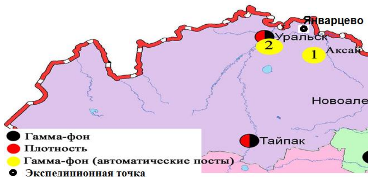
Рис. 1 Схема расположения метеостанций за наблюдением уровня радиационного гамма-фона и плотности радиоактивных выпадений на территории Западно-Казахстанской области

Все определяемые тяжелые металлы находились в пределах нормы.