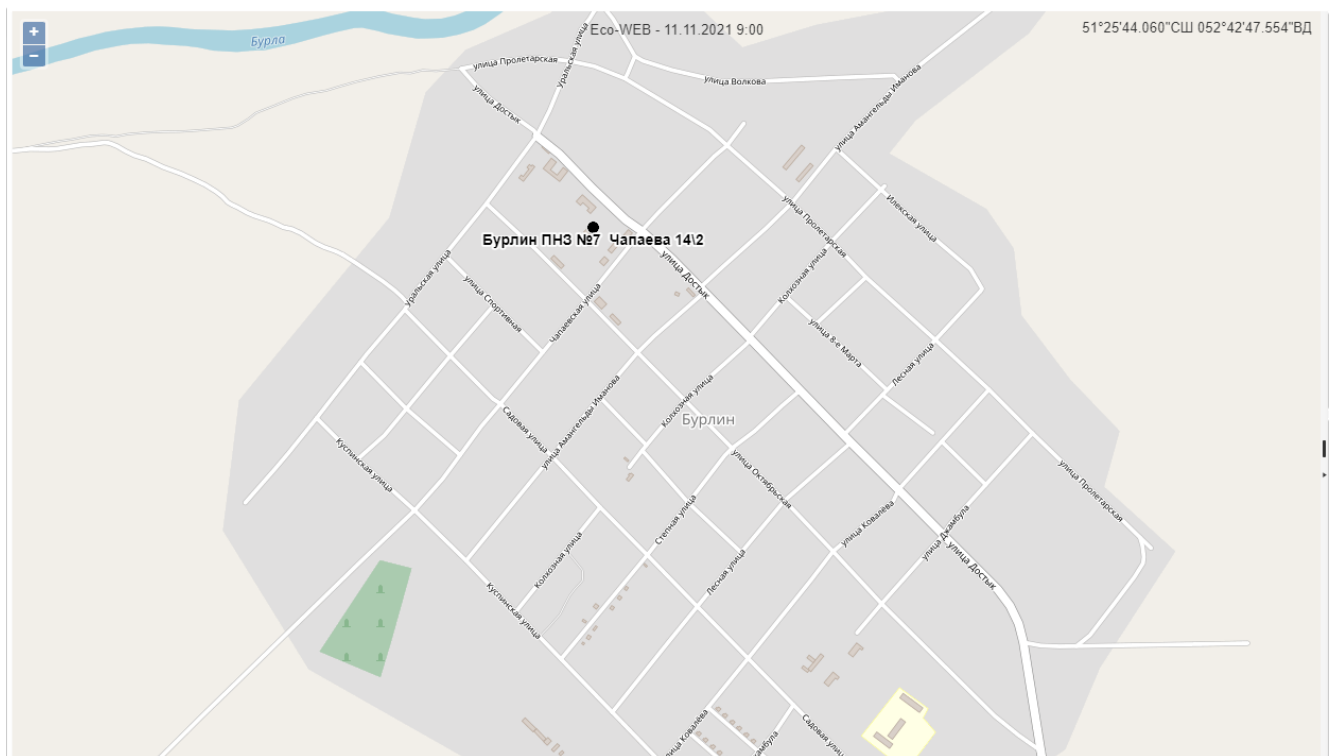
3 сур. – Бурлин а. қаласының атмосфералық ауа ластануын бақылау стационарлық желісінің орналасу сызбасы