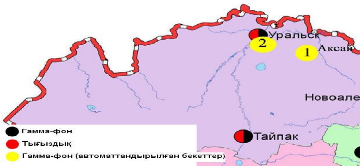
1-сур. Батыс Қазақстан облысының аумағындағы радиациялық гамма-фон мен радиоактивті түсулердің тығыздығын бақылау метеостансаларының орналасу сызбасы