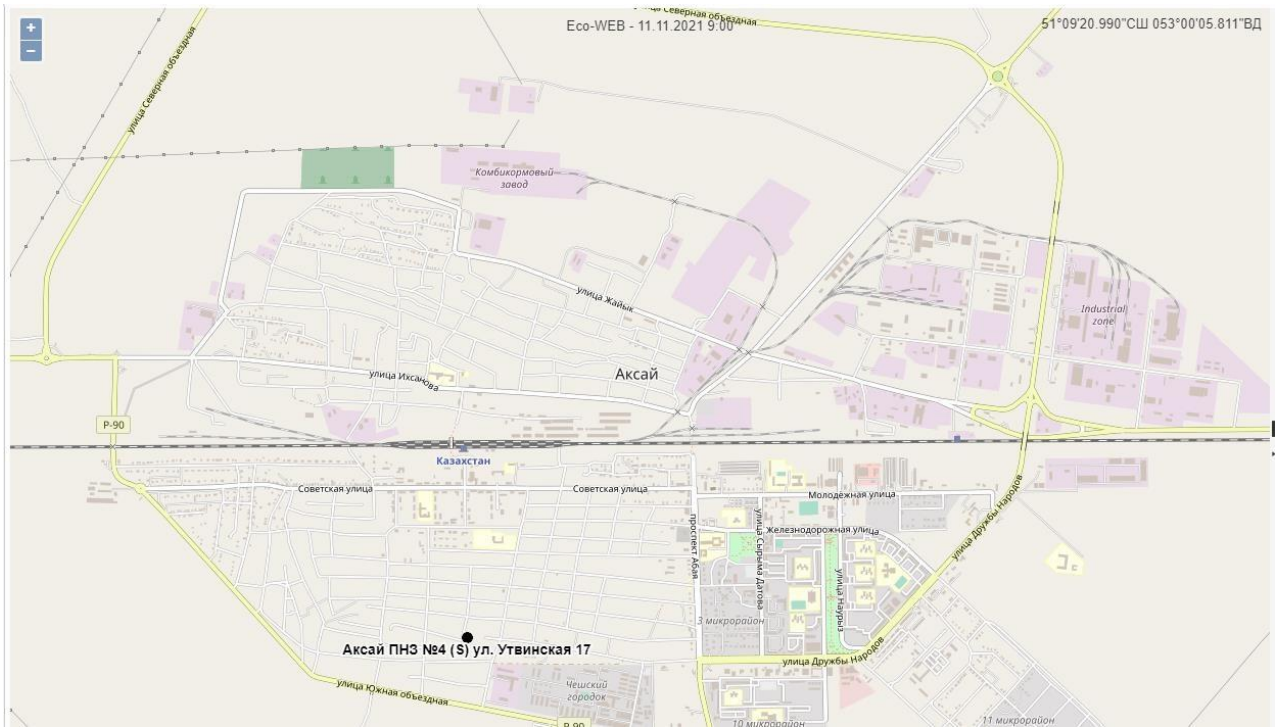
Рис.2 – карта мест расположения поста наблюдения г. Аксай