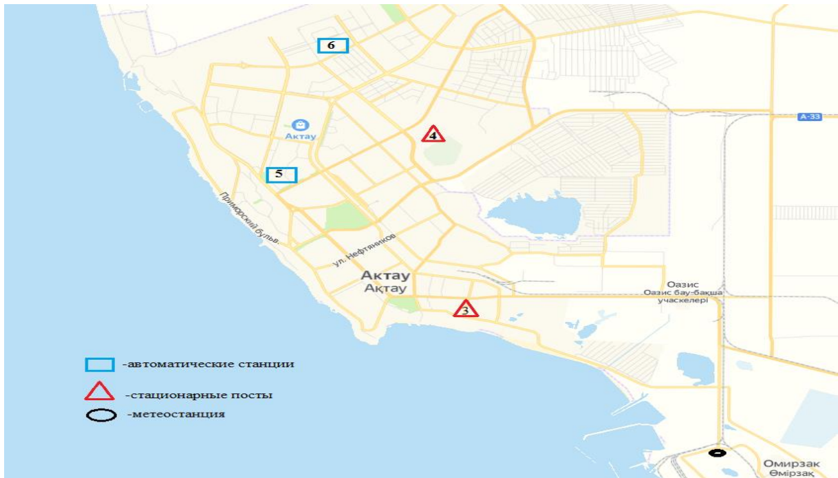
1 сурет – Ақтау қаласының атмосфералық ауа ластануын бақылау стационарлық желісінің орналасу сызбасы