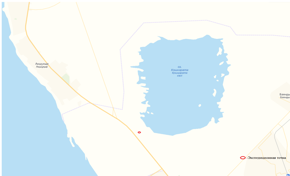
4 сурет – Қошқар-Ата қ/к экспедициялық нүктелерінің орналасу орындарының картасы