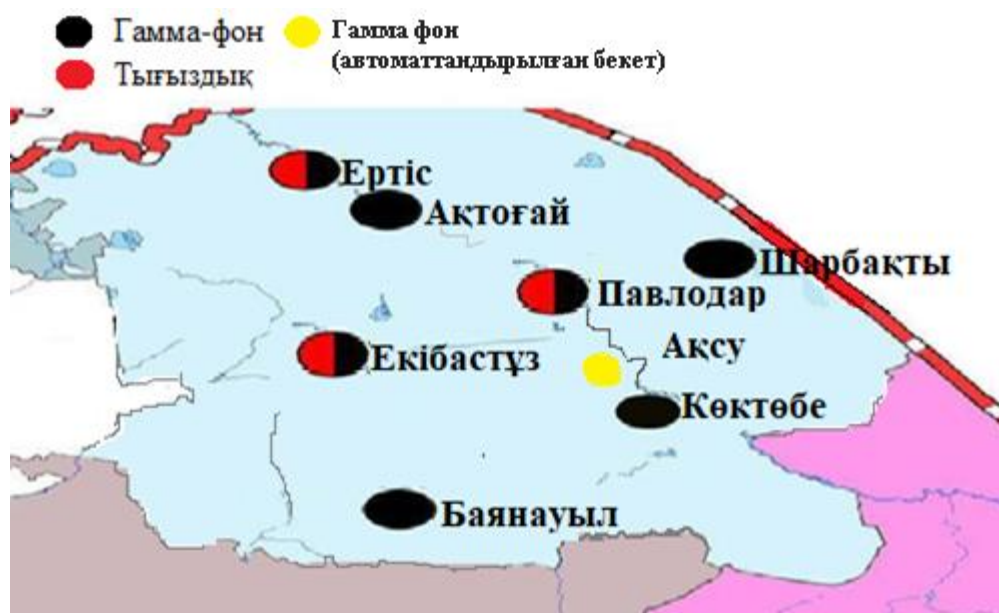
5-сурет. Павлодар облысының аумағында радиациялық фонды бақылайтын метеорологиялық станциялар орналасқан жерлердің картасы