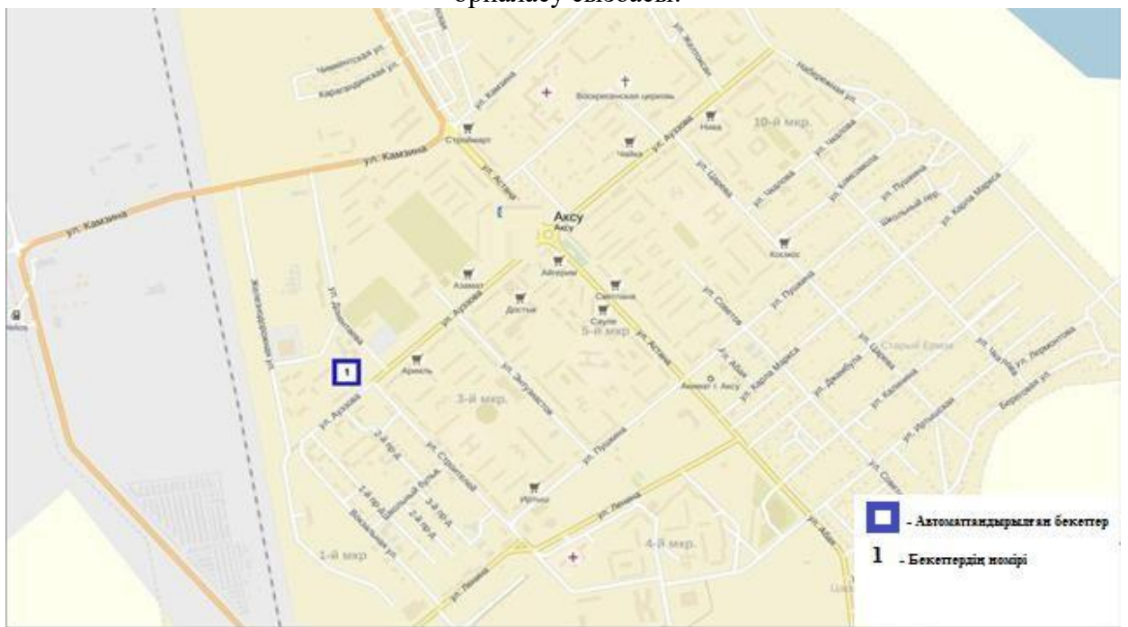
3-сурет. Ақсу қаласының атмосфералық ауластануын бақылау стационарлық желісінің орналасу сызбасы.