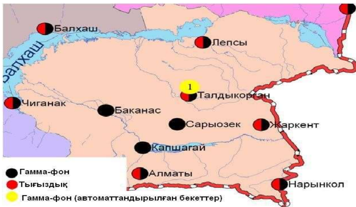
Алматы облысының аумағындағы радиациялық гамма-фон мен радиоактивті түсулердің тығыздығын бақылау метеостансаларының орналасу сызбасы.