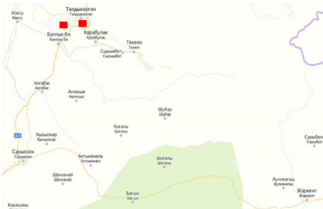
Талдықорған қаласында бақылау бекеттерінің орналасқан жерлерінің картасы