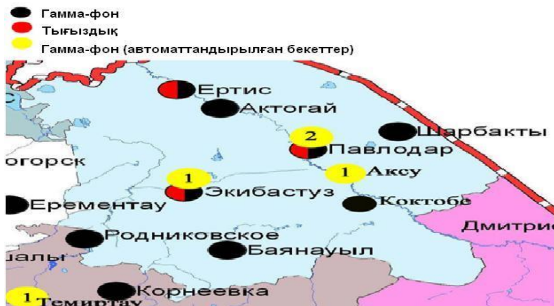
5-сурет. Павлодар облысының аумағындағы радиациялық гамма-фон мен радиоактивті үсулердің тығыздығын бақылау метеостансаларының орналасу сызбасы