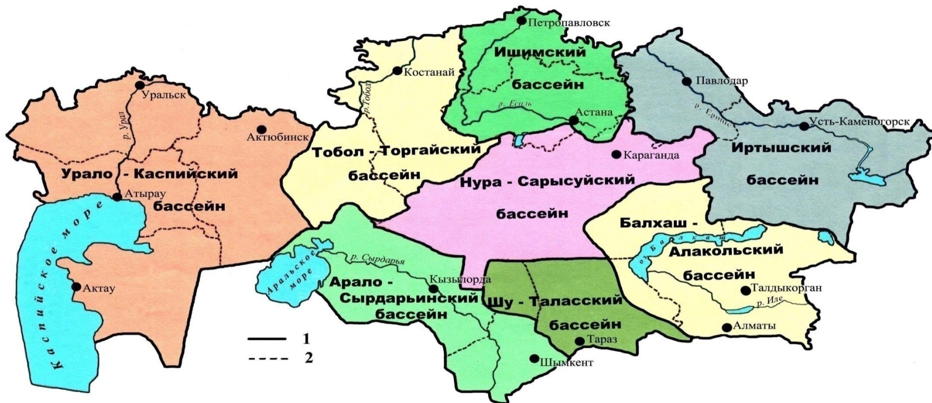
Схема деления издания «Ежегодные данные о режиме и ресурсах поверхностных вод суши» на выпуски (в соответствии с расположением водохозяйственных бассейнов Республики Казахстан)

1 – границы водохозяйственных бассейнов; 2 – границы административных областей