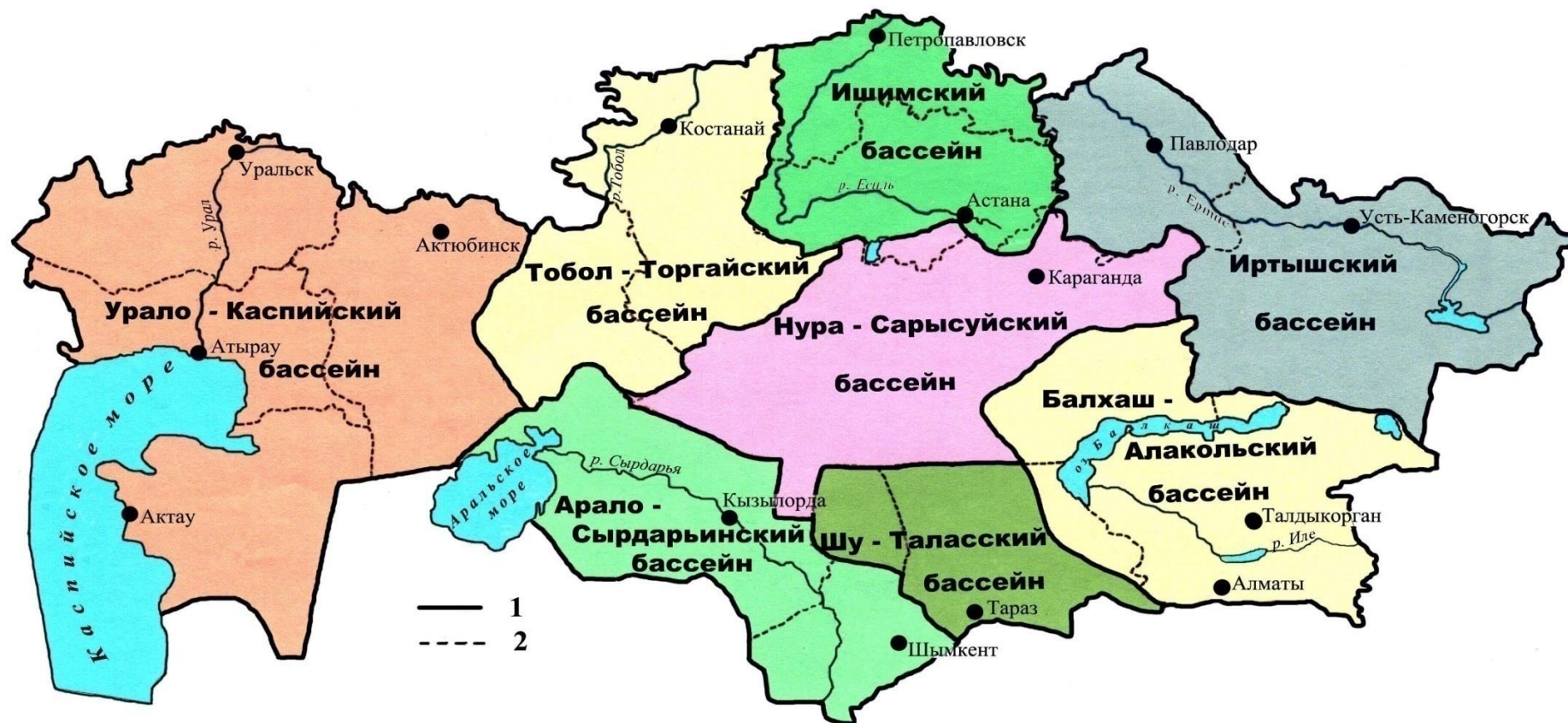
Схема деления издания «Ежегодные данные о режиме и ресурсах поверхностных вод суши» на выпуски (в соответствии с расположением водохозяйственных бассейнов Республики Казахстан)

1 – границы водохозяйственных бассейнов; 2 – границы административных областей