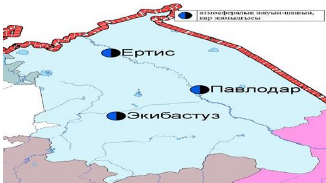
4 - сурет Павлодар облысы аумағындағы атмосфералық жауын-шашын мен қар жамылғысын бақылау метеостансаларының орналасу сызбасы