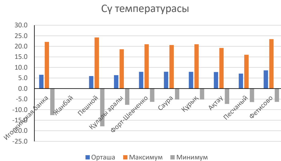
Сур.2. Су температурасы, °C