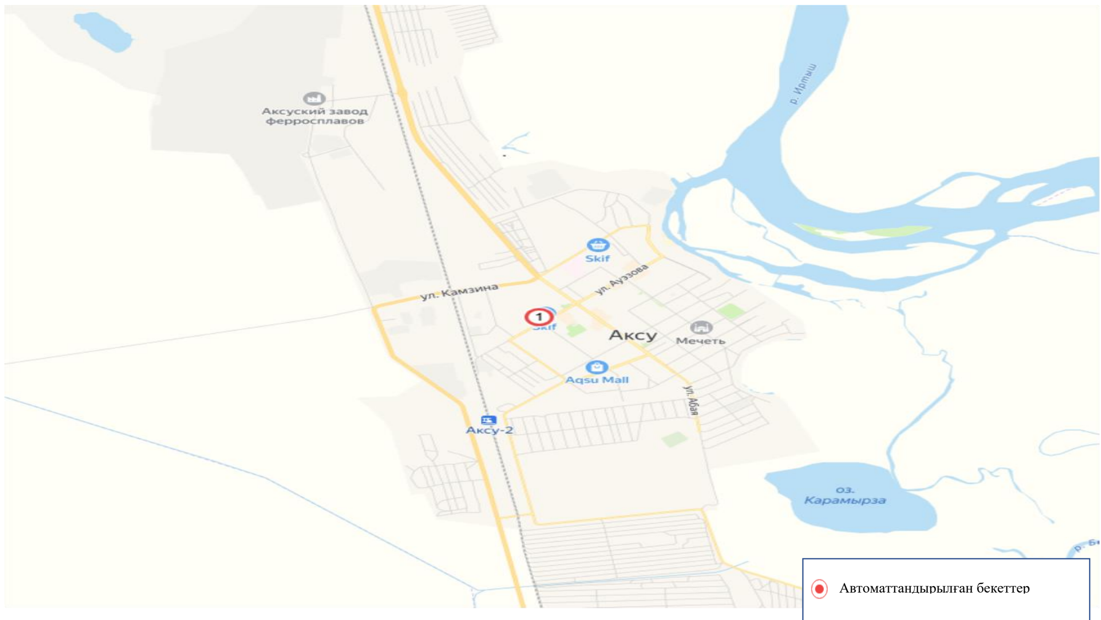
Ақсу қаласы бақылау бекетінің орналасқан жерінің картасы