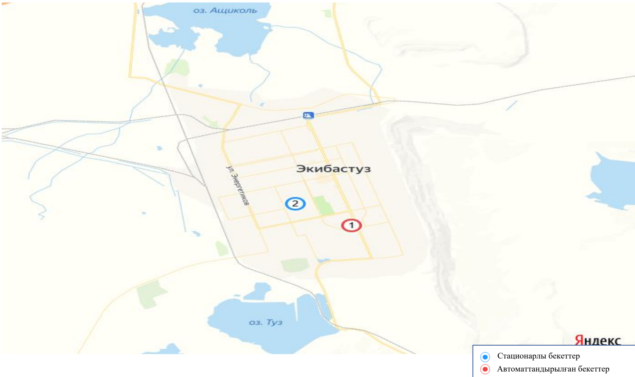
Екібастұз қаласы бақылау бекеттерінің орналасу картасы