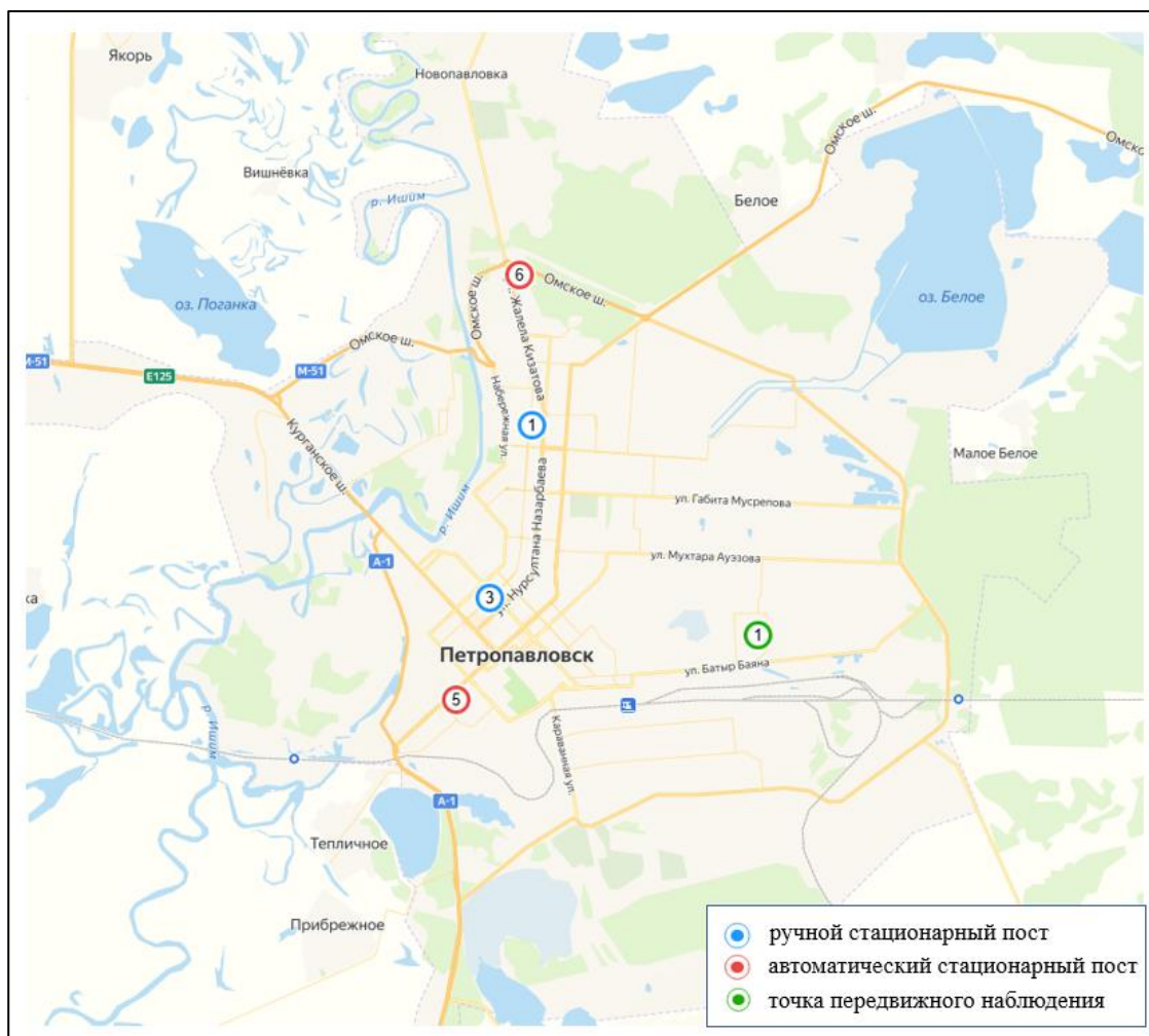
Рис.1 – Схема расположения стационарной сети наблюдения за загрязнением атмосферного воздуха СКО