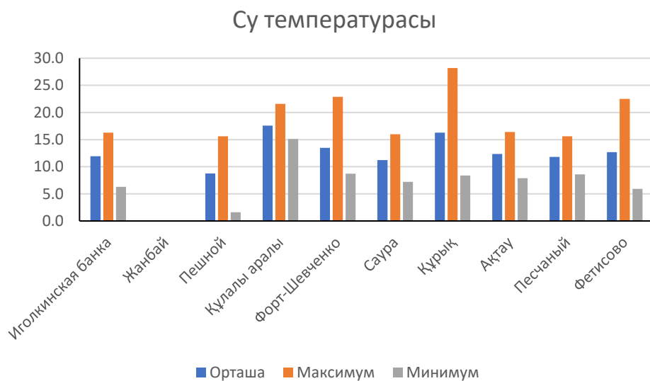
Сур.2. Су температурасы, °C