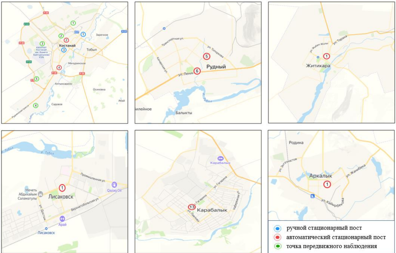
Бақылау посттары мен экспедициялық нұқшылердің орналасу картасы