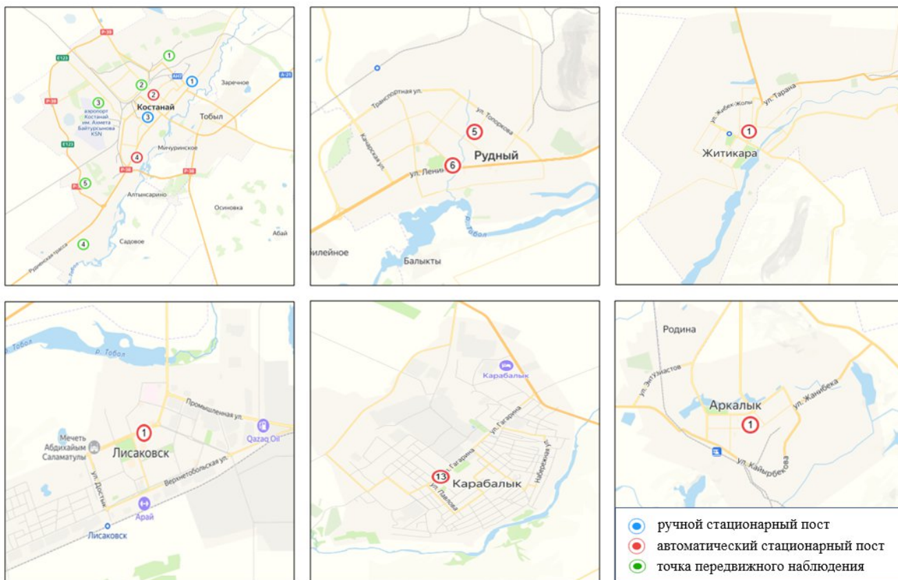
Бақылау посттары мен экспедициялық нүктелердің орналасу картасы