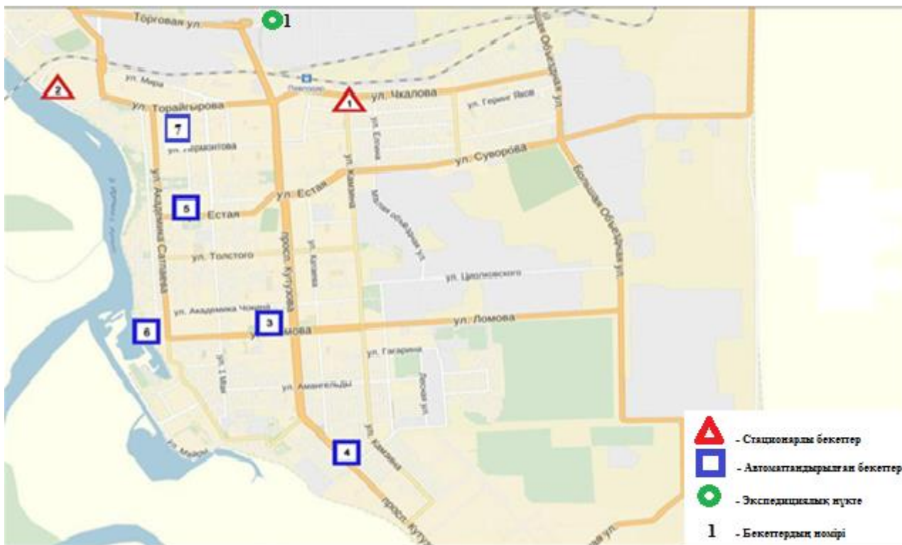
1-сурет. Павлодар қаласының атмосфералық ауа ластануын бақылау стационарлық желісінің орнала сусызбасы.