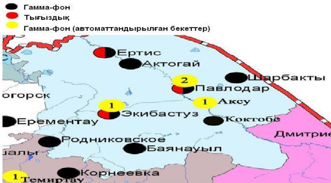
4-сурет. Павлодар облысынаумағындағырадиациялық гамма-фон мен радиоактивтігүсулердің тығыздығынбақылауметеостансаларыныңорналасусызбасы