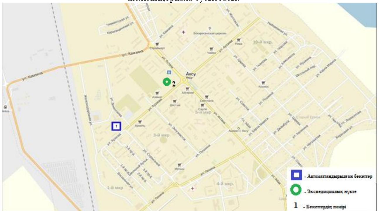
3-сурет. Ақсу қаласының атмосфералық ауластануын бақылау стационарлық желісінің орнала сусызбасы.