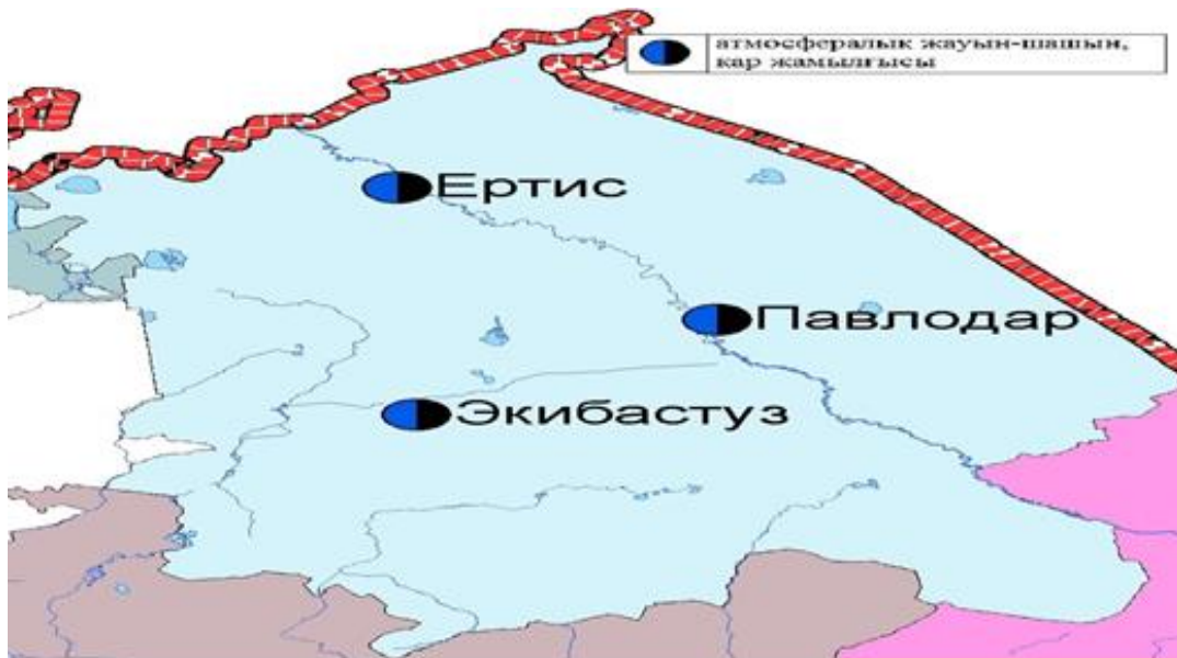
3-сурет Павлодар облысы аумағындағы атмосфералық жауын-шашын мен қар жамылғысын бақылау метеостансаларының орналасу сызбасы