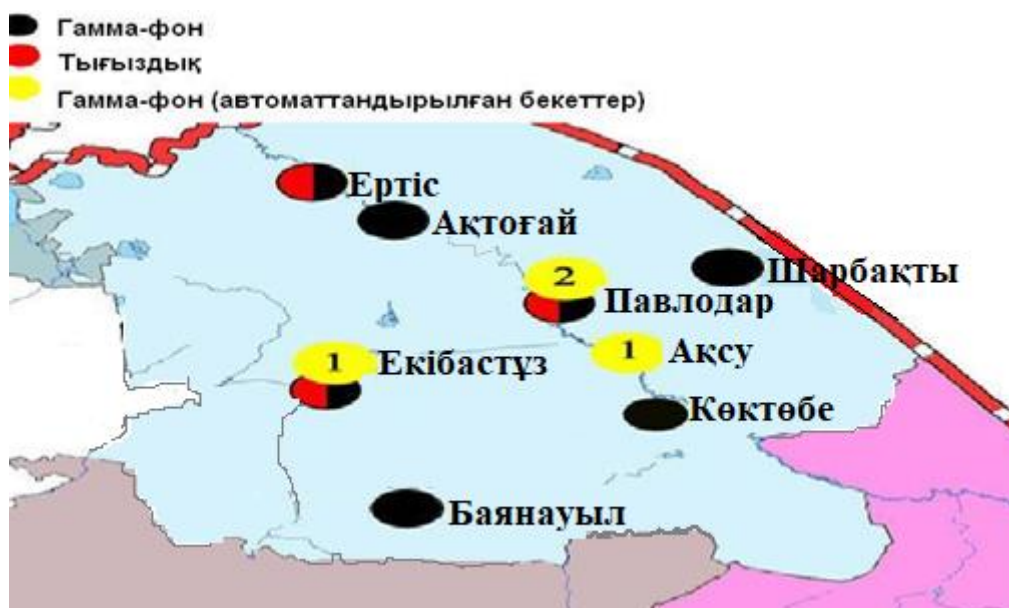
4-сурет. Павлодар облысының аумағындағы радиациялық гамма-фон мен радиоактивтігүсулердің тығыздығын бақылау метеостансаларының орналасу сызбасы