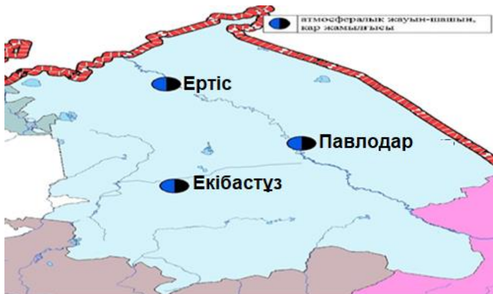
3-сурет Павлодар облысы аумағындағы атмосфералық жауын-шашын мен қар жамылғысын бақылау метеостансаларының орналасу сызбасы