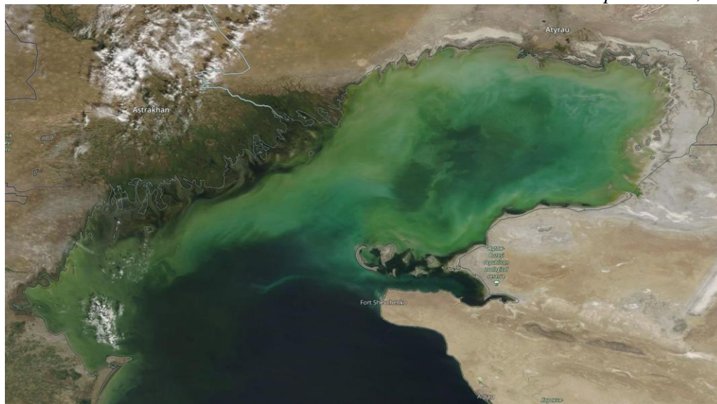
Рис.1 Космический снимок Каспийского моря, 04 сентября, 2022 г.