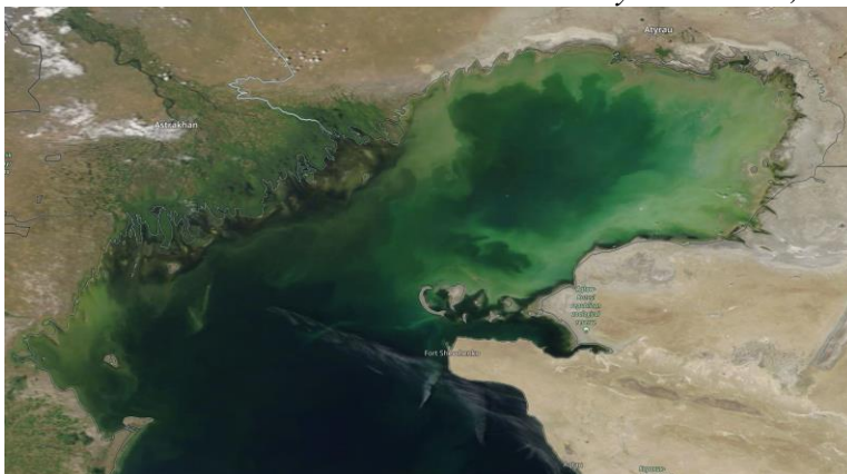
Рис.1 Космический снимок Каспийского моря, 02 августа, 2022 г.