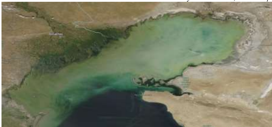
Рис.1 Космический снимок Каспийского моря, 21 августа, 2022 г.