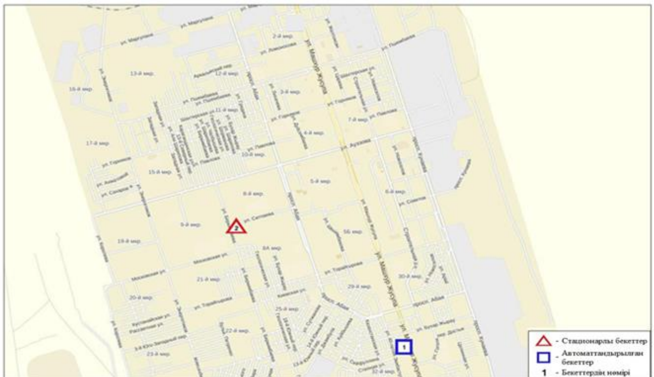
2-сурет. Екібастұз қаласының атмосфералық ауа ластануын бақылау стационарлық желісінің орнала сусызбасы.