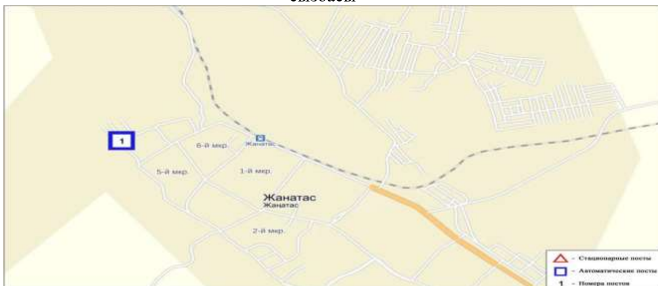
2-сурет. Жанатас қаласының бақылау бекеті мен метеостанциясының орналасу сызбасы