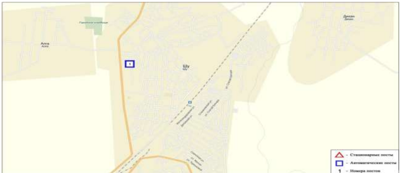
4-сурет. Шу қаласының бақылау бекетінің орналасу сызбасы