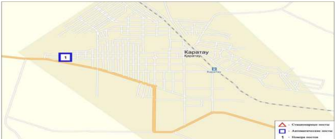
3-сурет. Қаратау қаласының бақылау бекеті мен метеостанциясының орналасу сызбасы