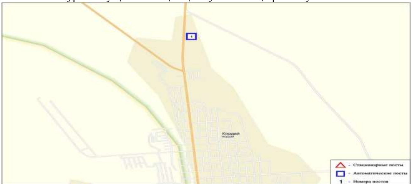
5- сурет- Қордай к. бақылау бекетінің орналасу сызбасы