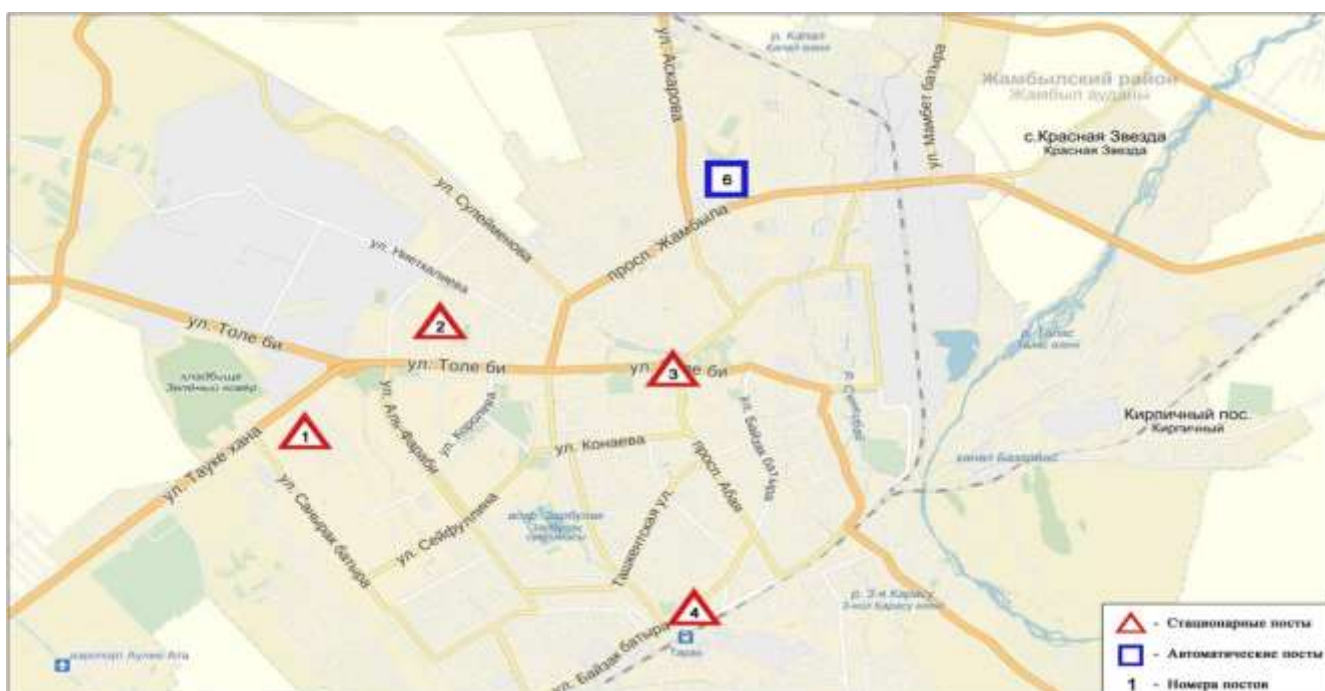
1-сурет. Тараз қаласының бақылау бекеттері мен метеостанциясының орналасу сызбасы