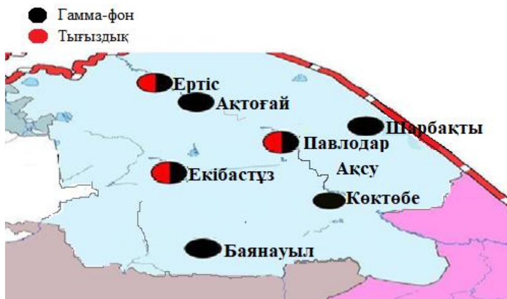
5-сурет. Павлодар облысының аумағында радиациялық фонды бақылайтын метеорологиялық станциялар орналасқан жерлердің картасы