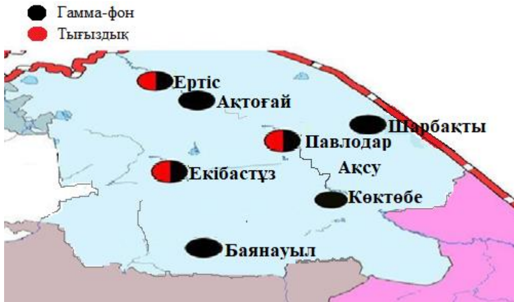
5-сурет. Павлодар облысының аумағында радиациялық фонды бақылайтын метеорологиялық станциялар орналасқан жерлердің картасы