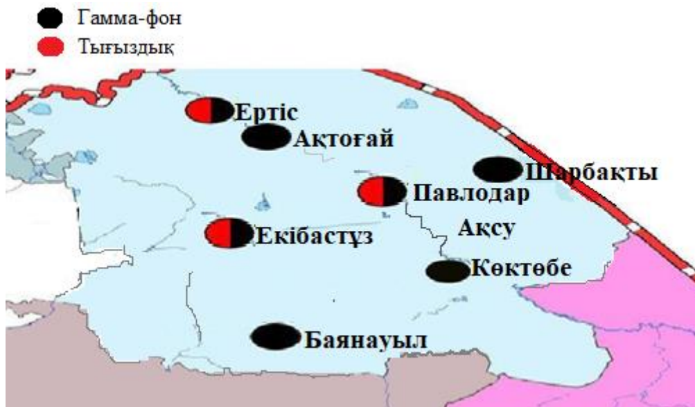
5-сурет. Павлодар облысының аумағында радиациялық фонды бақылайтын метеорологиялық станциялар орналасқан жерлердің картасы