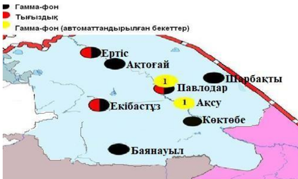
5–сурет. Павлодар облысының аумағында радиациялық фонды бақылайтын метеорологиялық станциялар орналасқан жерлердің картасы