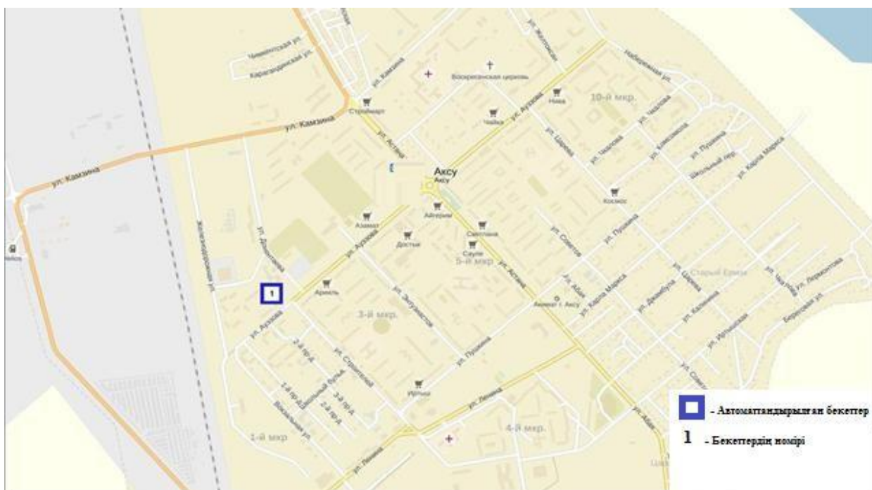
3-сурет. Ақсу қаласының атмосфералық ауластануын бақылау стационарлық желісінің орнала сусызбасы.