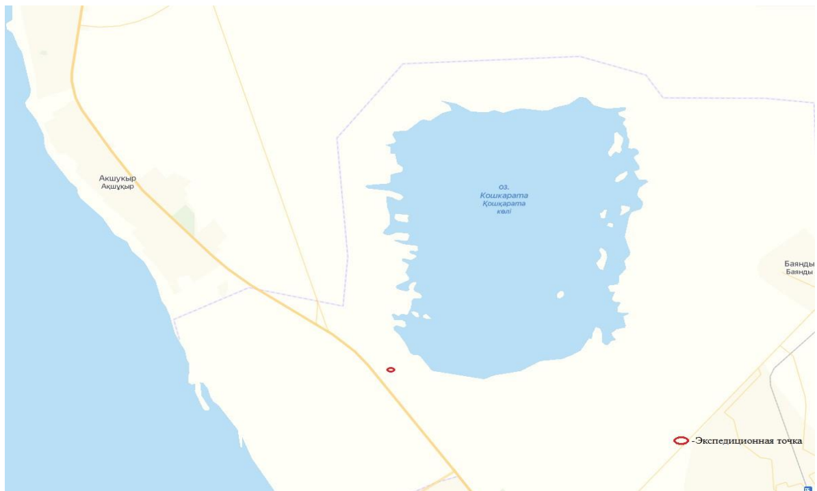
4 сурет – Қошқар-Ата к/к экспедициялық нүктелерінің орналасу орындарының картасы