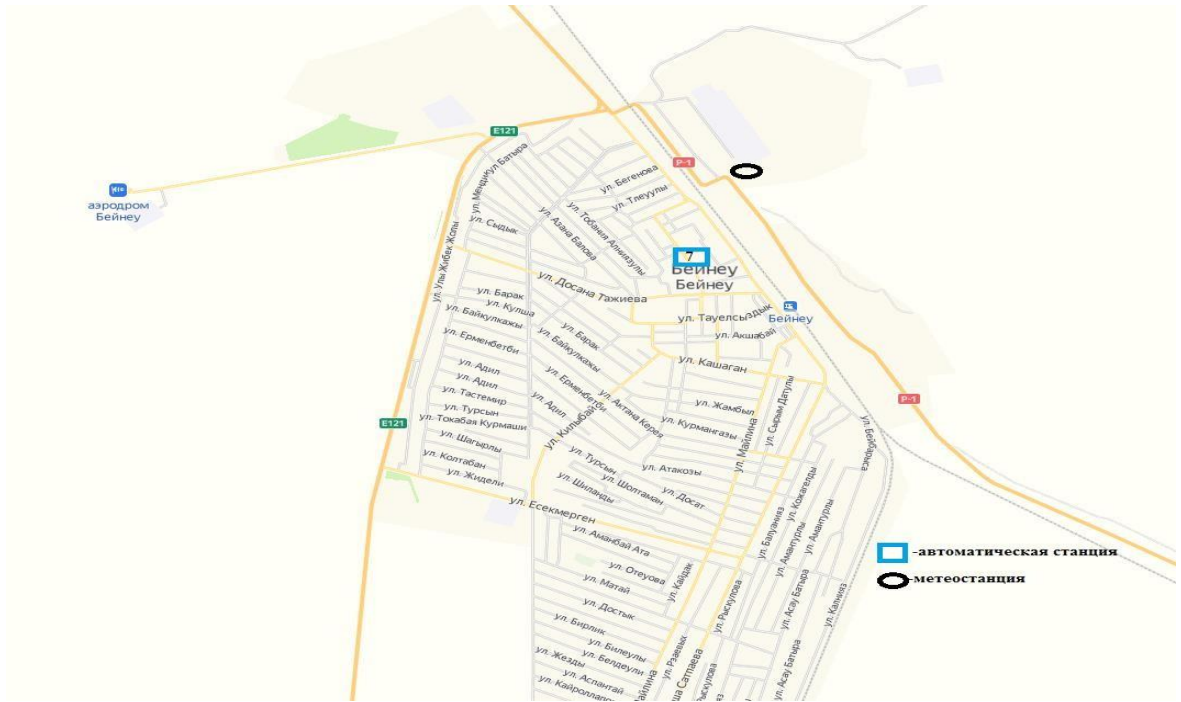
3 сурет – Бейнеу кентінің атмосфералық ауа ластануын бақылау стационарлық желісінің орналасу сызбасы