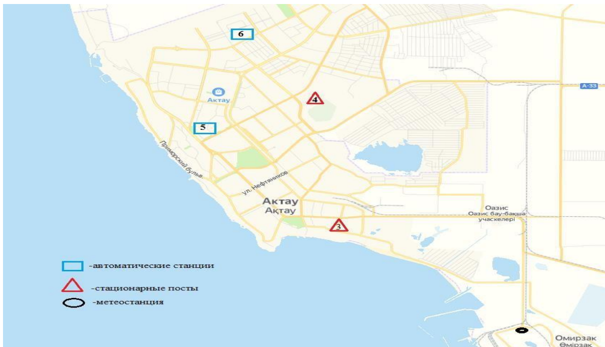
1 сурет – Ақтау қаласының атмосфералық ауа ластануын бақылау стационарлық желісінің орналасу сызбасы