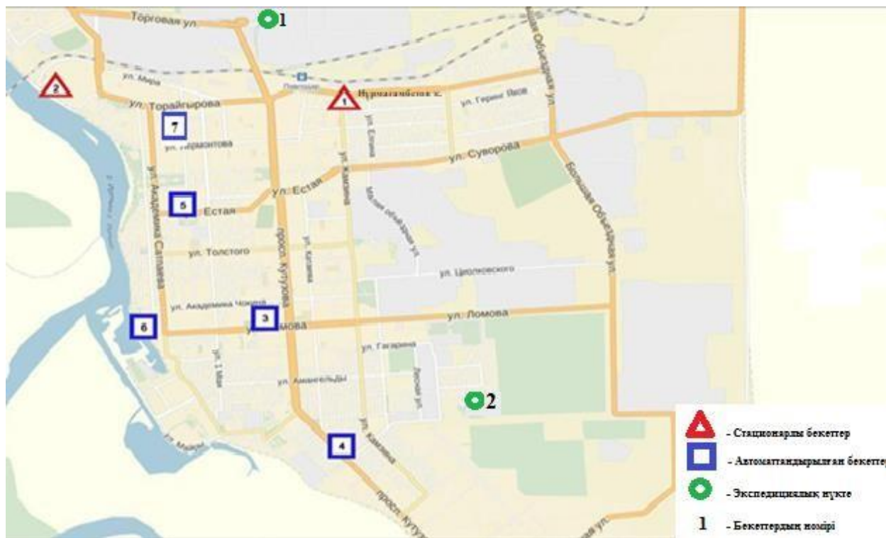
1-сурет. Павлодар қаласының атмосфералық ауа ластануын бақылау стационарлық желісінің орнала сусызбасы.