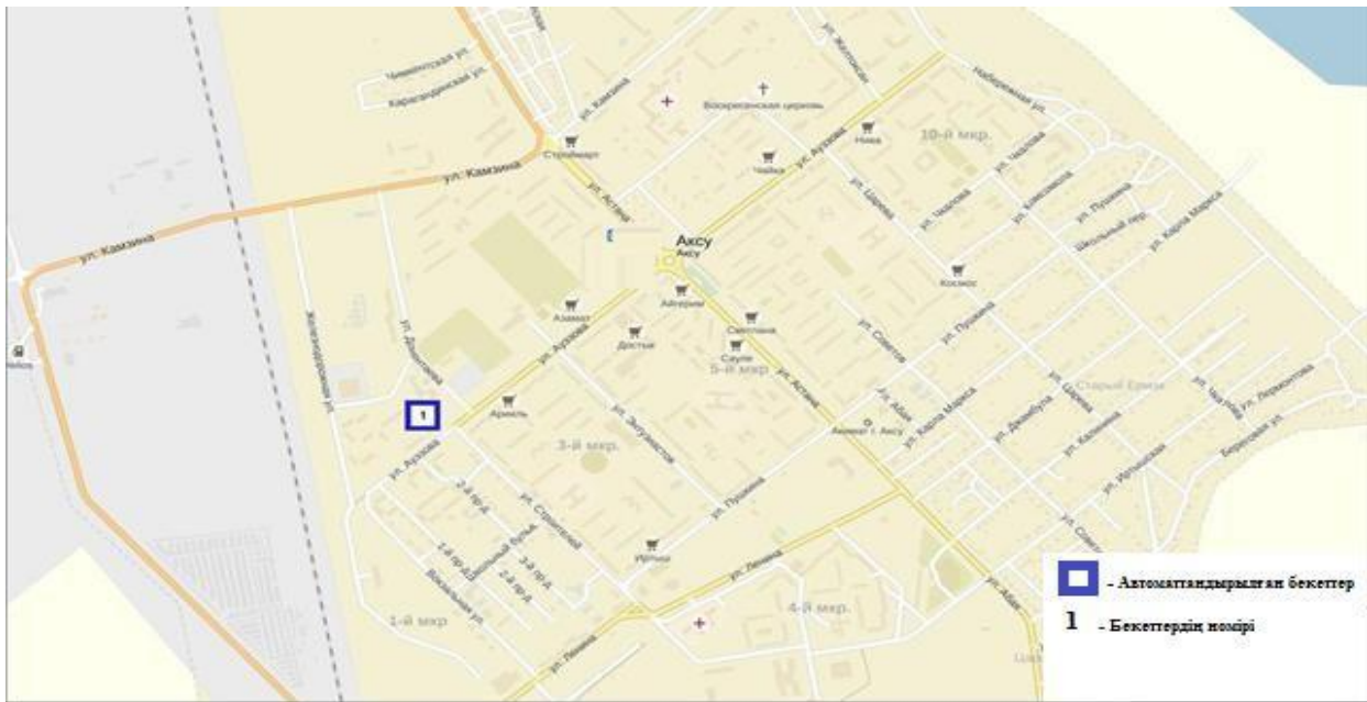
3-сурет. Ақсу қаласының атмосфералық ауаластануын бақылау стационарлық желісінің орнала сусызбасы.