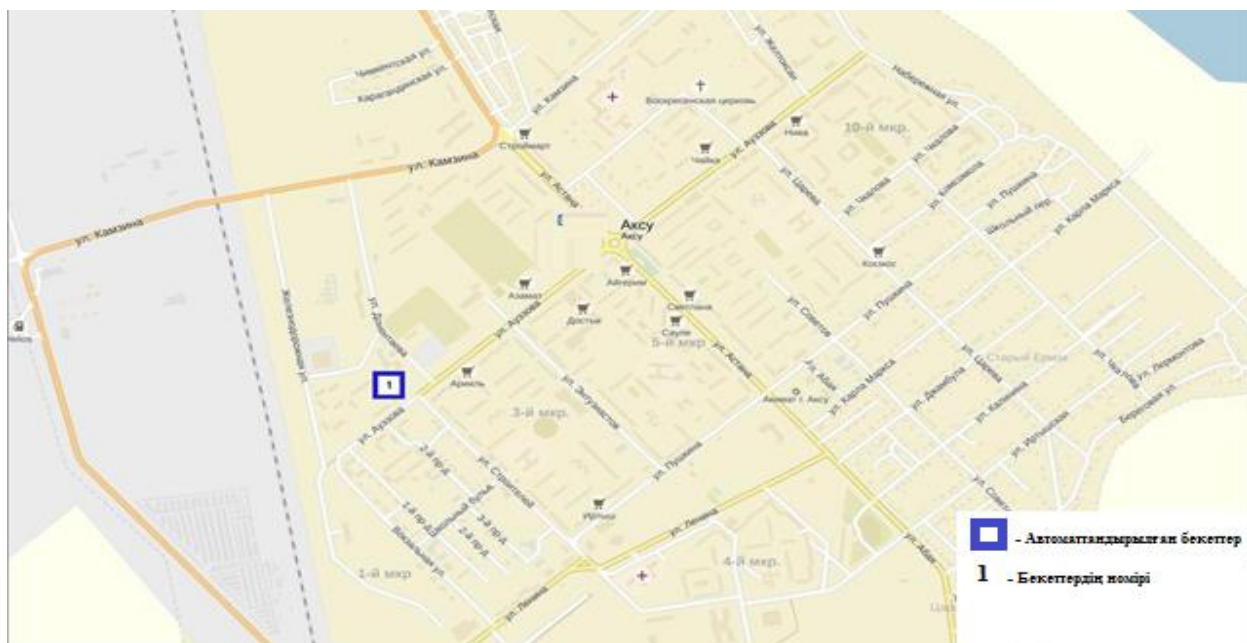
3-сурет. Ақсу қаласының атмосфералық ауаластануын бақылау стационарлық желісінің орнала сусызбасы.