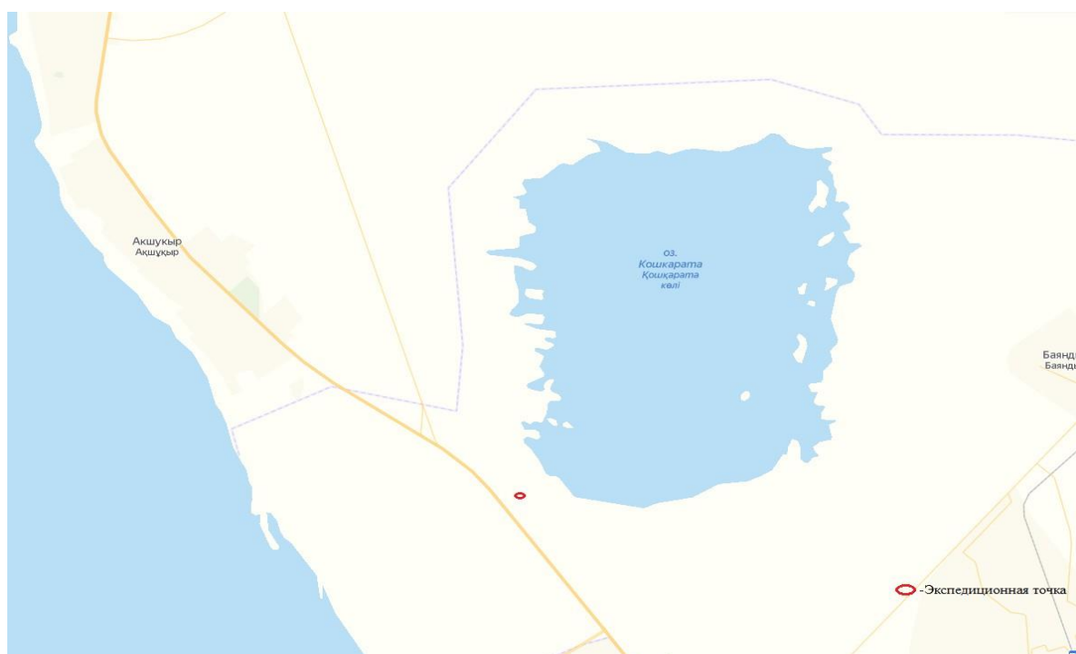
4 сурет – Қошқар-Ата к/к экспедициялық нүктелерінің орналасу орындарының картасы