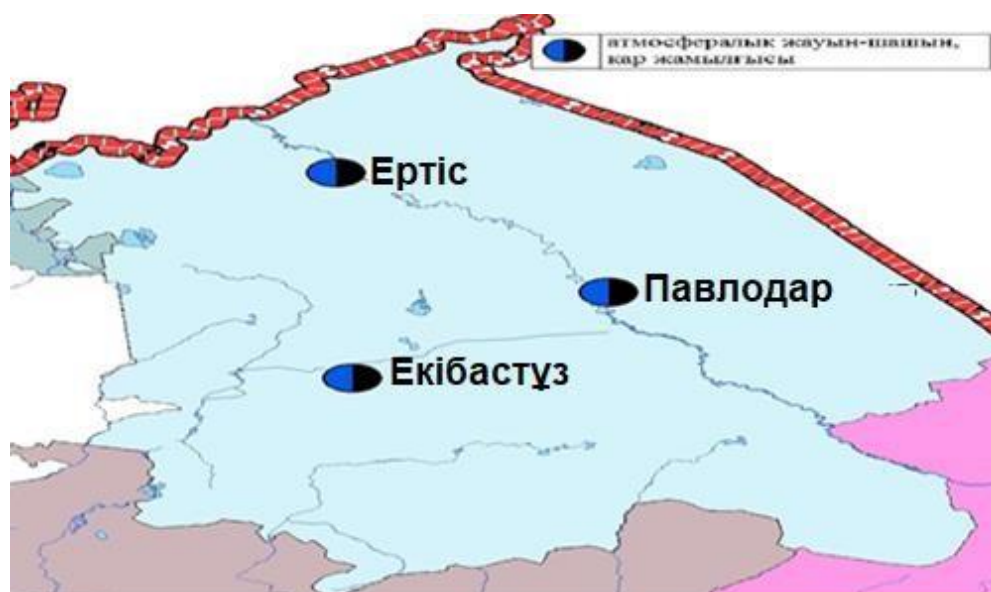
3-4-сурет Павлодар облысы аумағындағы атмосфералық жауын-шашын мен қар жамылғысын бақылау метеостансаларының орналасу сызбасы