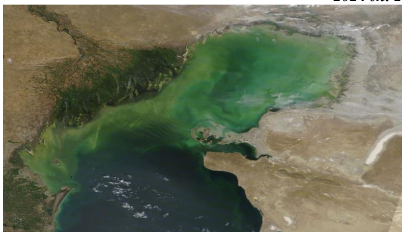
1-сурет. 2024 ж. 22 тамыз ғарыштан түсірілген Каспий теңізінің NASA/GSFC фотосуреті