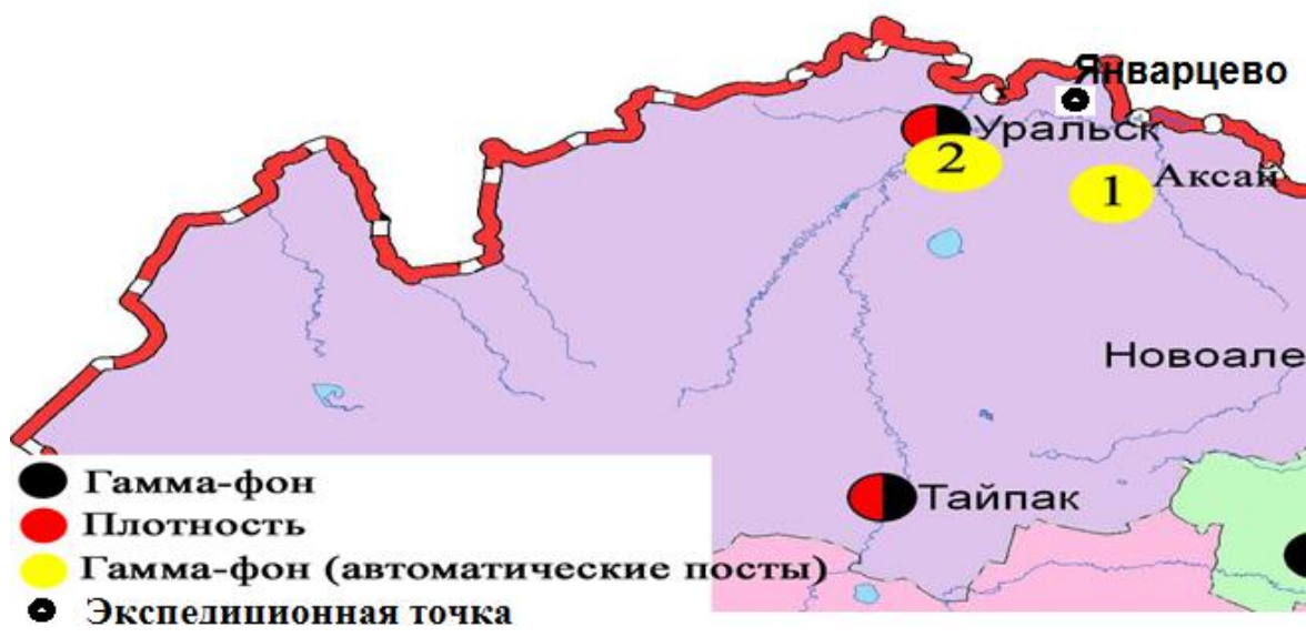
Рис. 1 Схема расположения метеостанций за наблюдением уровня радиационного гамма-фона и плотности радиоактивных выпадений на территории Западно-Казахстанской области