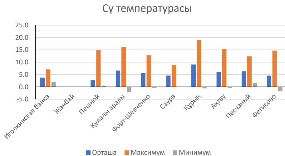
Сур.2. Сү температурасы, °C