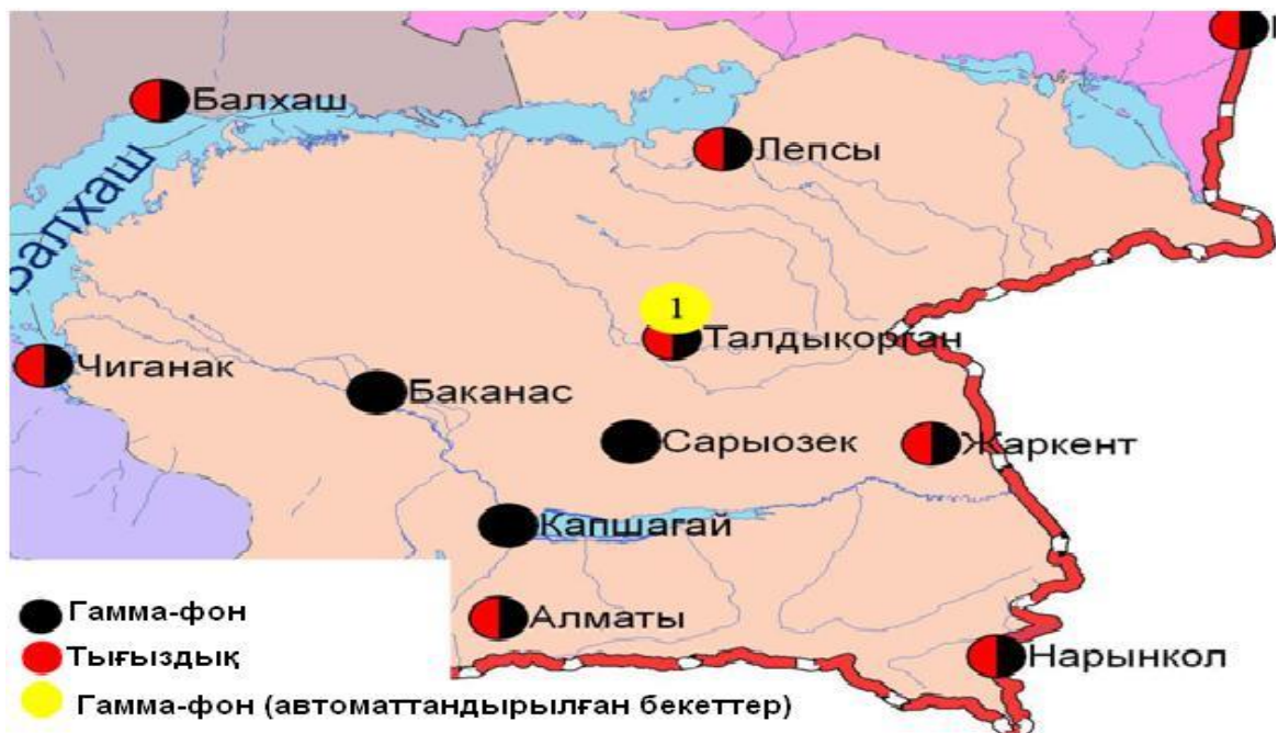
Алматы облысының аумағындағы радиациялық гамма-фон мен радиоактивті түсулердің тығыздығын бақылау метеостансаларының орналасу сызбасы. Сурет-2.