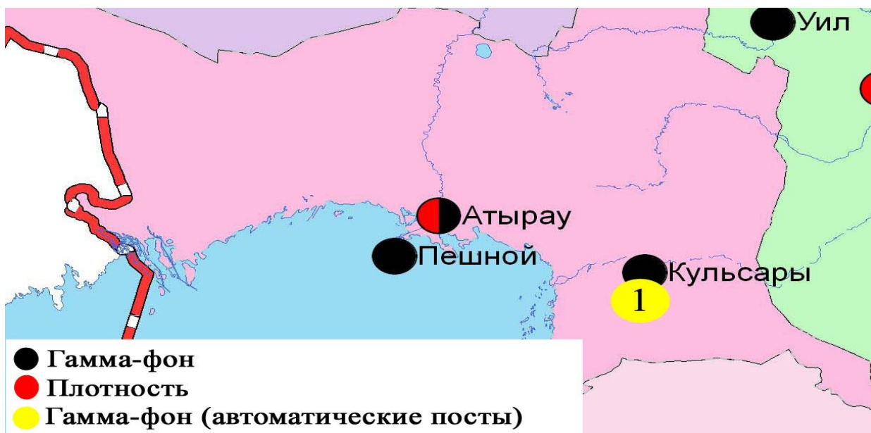
Атырау облысының аумағындағы радиациялық гамма-фон мен радиоактивті түсулердің тығыздығын бақылау метеостансаларының орналасу сызбасы