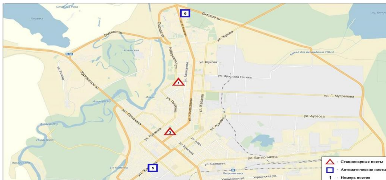
Рис.1 – Схема расположения стационарной сети наблюдения за загрязнением атмосферного воздуха СКО